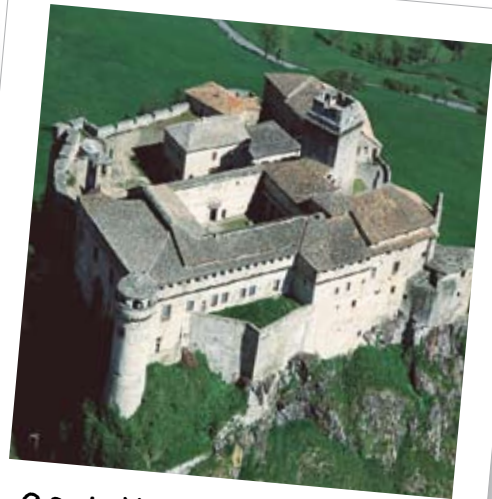
Castello di Bardi